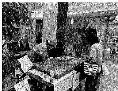
POPUP スペース（一度に3～4事業者程の出展が可能）