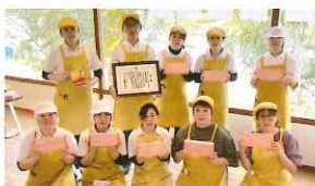
農事組合法人 東山産業さん