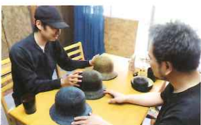
有限会社 丸高製帽所さん