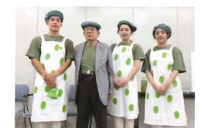
株式会社 松風庵かねすえさん