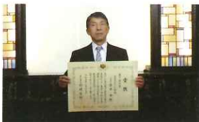
株式会社 おがた食研さん