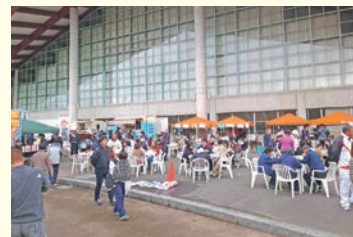
あいらぶ東かがわ大物産展