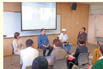
ローカルスタートアップサミット