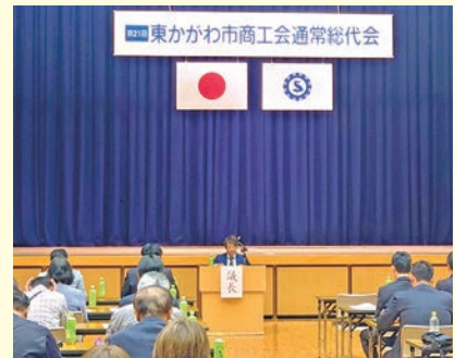
松村副会長による議事進行