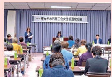
女性部総会の様子

令和6年度事業計画については、部員の資質向上に努めるとともに、社会貢献活動としてプルタブ・エコキャップの回収、交通事故防止を目的とした「交通安全キャンペーン」の実施、部員を対象とした体験学習や日帰り研修旅行の実施、各種イベントなど地域振興事業への参画を決議しました。