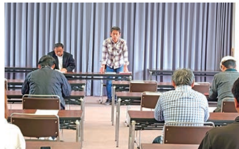
総合振興企画・組織財政合同委員会

第1回理事会を4月18日(木)に開催いたしました。 5月に開催される通常総代会へ提出する議事について会長を議長として副会長及び理事で協議し、承認された議事は総代会へ送られました。