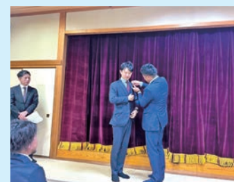
内海新部長(左)へバッジの引継ぎ