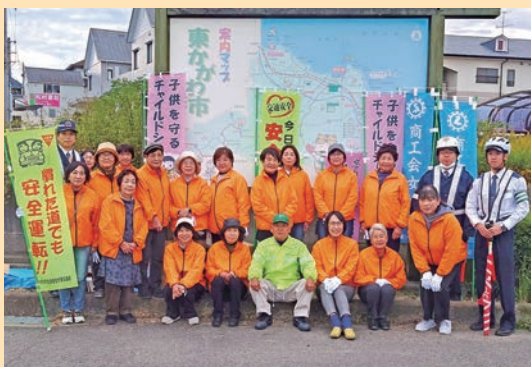
交通安全キャンペーンの様子